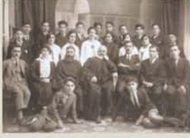
Η αρμένικη εκπαίδευση στην Κύπρο