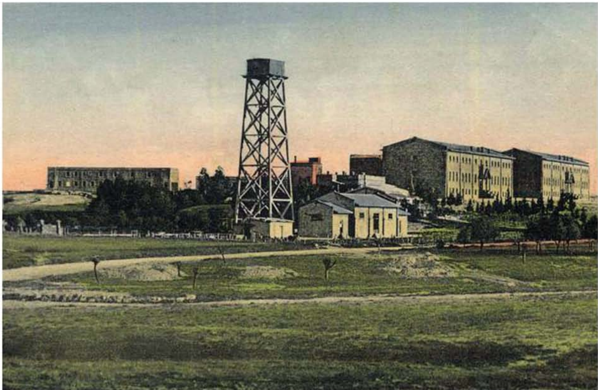
Πανοραμική άποψη του Εκπαιδευτικού Ινστιτούτου Μελκονιάν (1926).

Με το θάνατο του ευεργέτη, η έπαυλή του χρησιμοποιόταν πλέον ως κατοικία του εκάστοτε Διευθυντή, ενώ το σχολείο άρχισε να λειτουργεί ως δευτεροβάθμια σχολή, δεχόμενη και