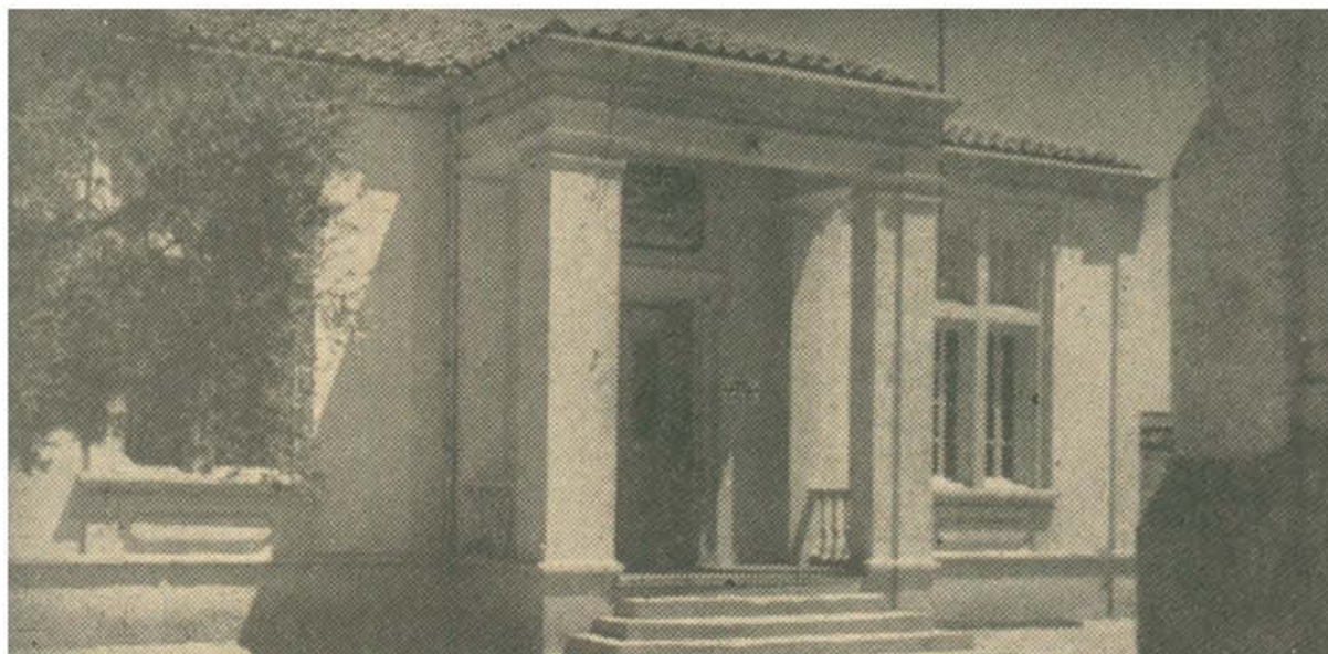
Το Σχολείο Μελικιάν (1960).

λιάν και τη μελωδία ο μεγάλος μουσουργός Βαχάν Μπετελιάν στα μέσα της δεκαετίας του 1930.