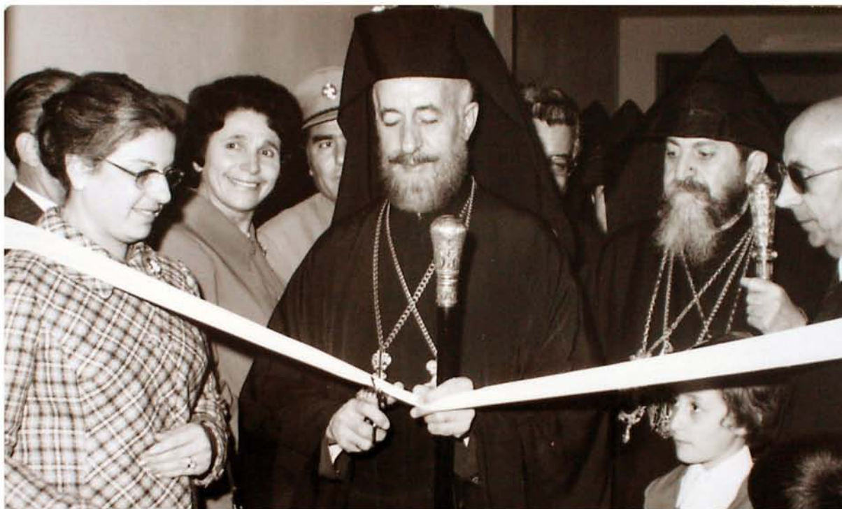
Ο Αρχιεπίσκοπος Μακάριος Γ΄ τελεί τα εγκαίνια του Ναρέκ Λευ- κωσίας (1972).

(Ντικράν, Μελίκ, Χαίραπέτ και Μαρί) ανήγειραν αμέσως - όπως όριζε στη διαθήκη του - το μεικτό «Εθνικό Σχολείο Μελικιάν», το οποίο λειτούργησε το Σεπτέμβριο του 1921 μέσα στο σύμπλεγμα της οδού Βικτωρίας και αντικατέστησε τα δύο προηγούμενα σχολεία. Αρχικά το σχολείο θεωρήθηκε πολύ μεγάλο, όμως ένα μόλις χρόνο μετά ήταν γεμάτο από Αρμενόπαιδα της Γενοκτονίας.