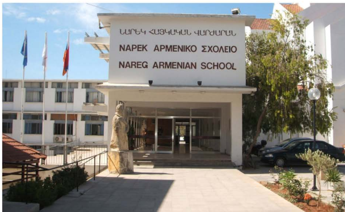
Το Αρμενικό Σχο- λείο Ναρέκ της Λευκωσίας.

αναβλήθηκε μέχρι που το θέμα ανακινήθηκε από το νεοε- κλεγέντα Εκπρόσωπο Δρ. Αντρανίκ Λ. Ααζιάν το 1970· το σκόπιμα κατασκευασμένο σχολικό κτίριο ανεγέρθηκε μεταξύ 1971-1972, με αρχιτέκτονα τον Πεύκιο Γεωργιάδη. Με την Απόφαση του Υπουργικού Συμβουλίου 11.027/23-12-1971, ορίστηκε ότι η σχετική παραχώρηση γης έγινε ως εμπιστευμα.