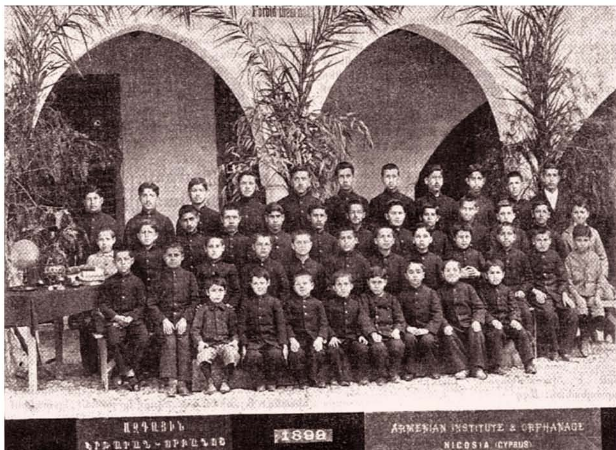
Մαθητές του Εθνικού Εκπαιδευτηρίου-Ορφανοτροφείου στο εργαστήριό τους (1899).

ԱՐՄԵՆԻԱՆ ԻՆՏԻՏՈՒՏ ԵՎ ՕՐՓԱՆՈՒՐՔԻՆ ԵՆՆԻՄԵՐ