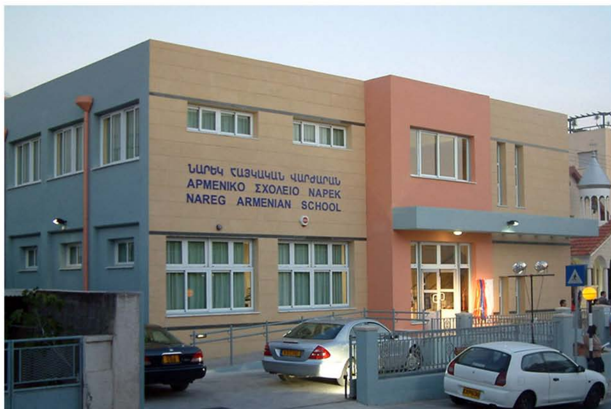
Το Αρμενικό Σχολείο Ναρέκ της Λεμεσού.