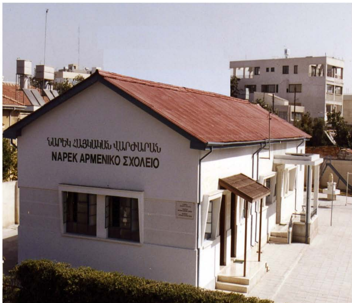
Το παλιό κτίριο του Ναρέκ Λεμεσού (1995).