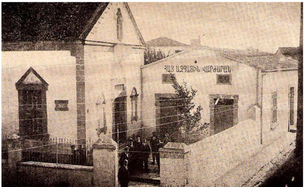
Το Αρμενικό Σχολείο της Λάρνακας (1925).

Το Εθνικό Αρμενικό Σχολείο εξυπηρετούσε για δεκαετίες τη μικρή αρμενική παροικία της πόλης του Ζήνωνα. Κατά τον εμφύλιο πόλεμο στο Λίβανο (1975-1990), η αυλή του φιλοξένησε αρκετούς Αρμένιους πρόσφυγες. Ωστόσο, με την πάροδο του χρόνου άρχισε να επιδεικνύει δομικές αδυ-