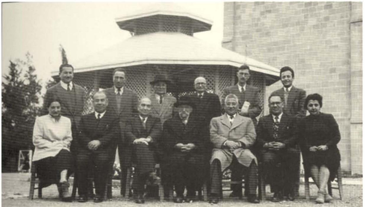
Αναμνηστική φωτογραφία των καθηγητών του Μελκονιάν μαζί με το μεγάλο συγγραφέα Arshag Chobanian μπροστά από το παλιό Μουσουλίο των Ευεργετών (1953)

Εκτός από το δικό του έμβλημα (μπλε θυρεός με κόκκινο περίγραμμα, με ερυθρόλευκο αετό και τα αρχικά της σχολής), έργο του μεγάλου Αρμενοκύπριου καλλιτέχνη Σεμπούχ Απκαριάν, το Μελκονιάν διέθετε και το δικό του ύμνο, το « Annah Louso » (Αθάνατοι του Φωτός), που καθημερινά τραγουδούσαν οι μαθητές στην πρωινή συγκέντρωση του σχολείου· τα λόγια έγραψε ο θεολόγος Ονίκ Μαχτεσιάν, ενώ τη μελοποίηση έκαμε ο μεγάλος μουσουργός Βαχάν Μπετελιάν στις αρχές της δεκαετίας του 1930. Γνωστό ως « ένα νησί μέσα σε ένα νησί », το Μελκονιάν υπήρξε ένα εκπαιδευτικό ίδρυμα με υψηλά ακαδημαϊκά