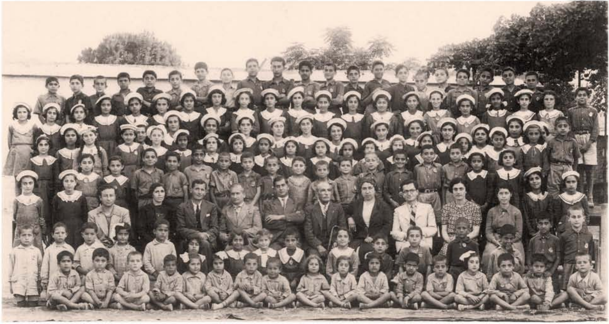
Οι μαθητές του Αρμενικού Σχο- λείου της Λάρ- νακας (1940).

ναμίες, καθιστώντας έτσι επιτακτική την ανάγκη ανέγερσης ενός νέου κτιρίου. Χάρη στον Εκπρόσωπο Αράμ Καλαϊτζιάν, οι Τεχνικές Υπηρεσίες του ΥΠΠ, με αρχιτέκτονα την Ανδρούλλα Δημητρίου, ανήγειραν το νέο κτίριο μεταξύ 1993-1995, πίσω από την εκκλησία. Τα εγκαίνια τέλεσε στις 18 Μαΐου 1996 ο Πρόεδρος Γλαύκος Κληρίδης· το παλιό κτίριο κατεδαφίστηκε το 2007.