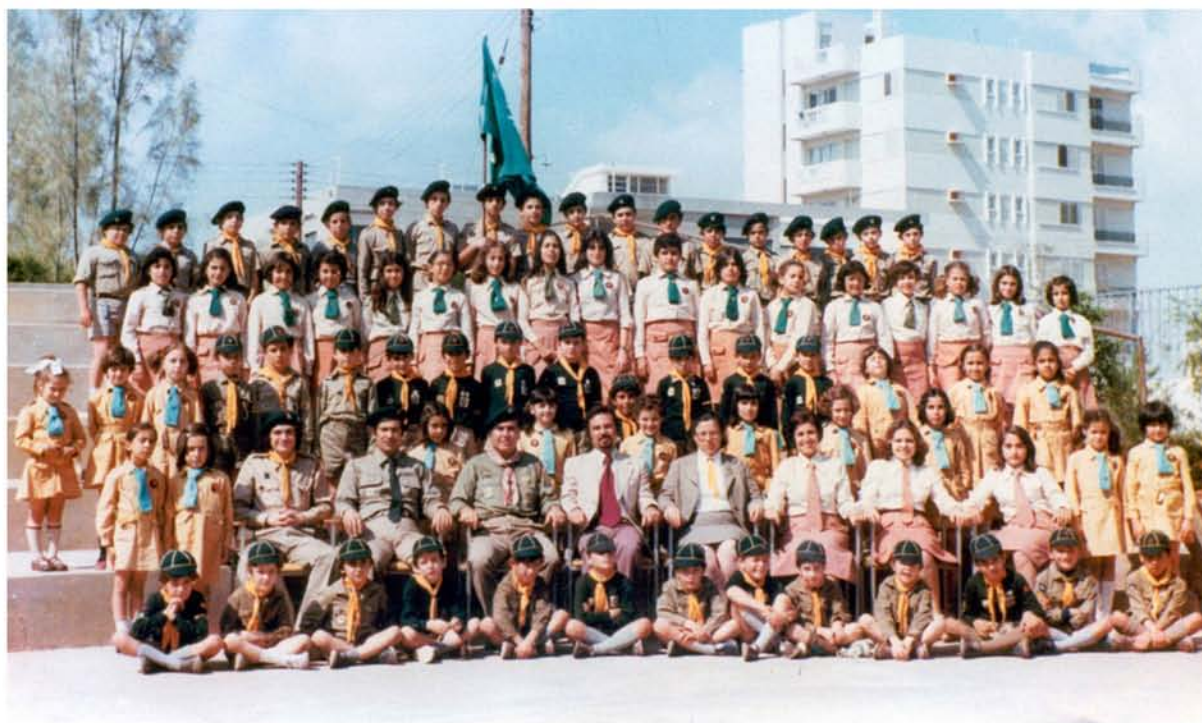
Οι πρόσκοποι του Ναρέκ Λευκω- σίας (1976).