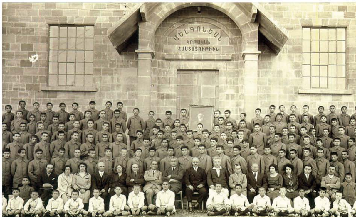
Οι μαθητές και οι μαθήτριες του Μελκονιάν (1930)