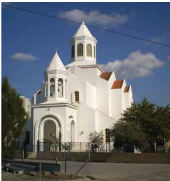
• Ο καθεδρικός ναός της Παναγίας στη Λευκωσία (2012).