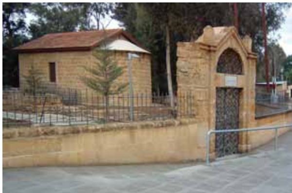
• Το παρεκκλήσι του Αγίου Παύλου και η εντυπωσιακή πύλη του παλαιού αρμενικού κοιμητηρίου στη Λευκωσία (2010).