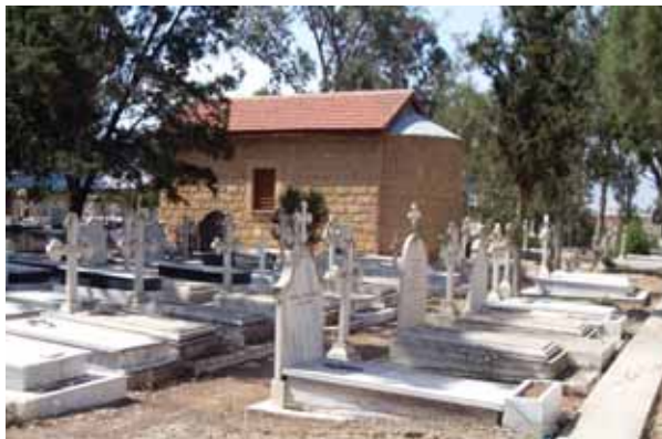
• Το παρεκκλήσι της Αγίας Αναστάσεως στο κοιμητήριο του Αγίου Δομετίου (2010).