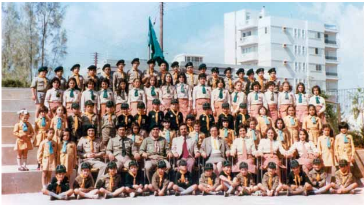
● Το 4 ο Σύστημα Προσκόπων Κύπρου του Σχολείου Ναρέκ Λευκωσίας (1976).

500 ορφανά της Αρμενικής Γενοκτονίας. Το άλσος μπροστά απ' αυτό φυτεύτηκε από τα πρώτα εκείνα ορφανά, εις μνήμην των χαμένων συγγενών τους. Εξελίχθηκε από ορφανοτροφείο (1926-1940) σε μια φημισμένη δευτεροβάθμια σχολή (1934-2005) με οικοτροφείο. Ένα μοναδικό και απaráμιλλο επίτευγμα, το Μελκονιάν υπήρξε φάρος ελπίδας και πολιτισμού για τον απανταχού αρμενισμό και την ανά τον κόσμο αρμενοφωνία. Μπορούσε να καυχιέται για μια διεθνή συμμετοχή Αρμενίων μαθητών από ολόκληρη την υφήλιο και ορθά αποκαλείτο πρεσβευτής της Κύπρου στην οικουμένη. Εκτός από την πλούσια βιβλιοθήκη και τα άρτια εξοπλισμένα εργαστήριά του, το Μελκονιάν διέθετε θεατρική και χορευτική ομάδα, χορωδία, φιλαρμονική, ομάδες ποδοσφαίρου, καλαθόσφαιρας και πετόσφαιρας, καθώς και το ιστορικό 7 ο Σύστημα Προσκόπων Κύπρου και την 9 η Ομάδα Οδηγών Κύπρου.