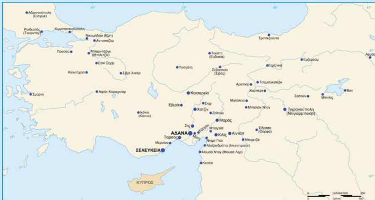
Χάρτης με τους τόπους προέλευσης των Αρμενοκυπρίων

Σχεδιασμός του χάρτη από τον Αλέξανδρο-Μιχαήλ Χατζηπύρα