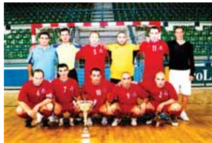
● Η πρωταθλήτρια και κυπελλούχος ομάδα φούτσαλ AGBU-Αραράτ (2007).