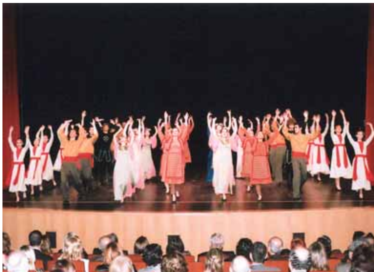
● Η γνωστή χορευτική ομάδα «Σιπάν» (2009).