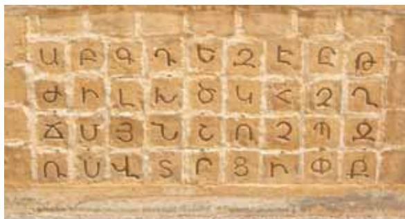
• Το μνημείο για το Αρμενικό Αλφάβητο στο Ινστιτούτο Μελκονιάν.