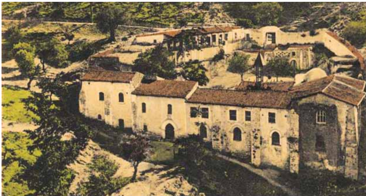
● Ταχυδρομικό δελτάριο που απεικονίζει το Ξακουστό Μοναστήρι του Αγίου Μακαρίου (1926).

Λατινοκρατία: Μετά την αγορά της Κύπρου από τον τιτουλάριο Φράγκο Βασιλιά της Ιερουσαλήμ Γκυ ντε Λουζινιάν το 1192, έλαβε χώρα μια μαζική μετανάστευση Αρμενίων και άλλων αστών, ευγενών, ιπποτών και πολεμιστών από τη Δυτική Ευρώπη, την Κιλικία και το Λεβάντε, στους οποίους παραχωρήθηκαν απλόχερα φέουδα, τιμάρια και προνόμια. Λόγω της εγγύτητάς τους, των εμπορικών τους δεσμών και μιας σειράς γάμων, τα Βασίλεια Κύπρου και Κιλικίας αλληλοσυνδέθηκαν. Στους μετέπειτα αιώνες, χιλιάδες Κιλικιοαρμένιοι αναζήτησαν καταφύγιο στην Κύπρο διαφεύγοντας από τις μουσουλμανικές ορδές και επιθέσεις. Λόγω της συνεχούς παρακμής της Μικρής Αρμενίας, ο τελευταίος της Βασιλιάς, Λέων Ε΄, κατέφυγε στην Κύπρο το 1375. Μετά το θάνατό του στο Παρίσι το 1393, ο τίτλος και τα προνόμιά του μεταβιβάστηκαν στον εξάδελφό του, Βασιλιά Ιάκωβο Α΄ Λουζινιανό, στον καθεδρικό ναό της Αγίας Σοφίας το 1396-ακολουθώντας, ο βασιλικός θυρεός έφερε και το λείοντα της Αρμενίας.