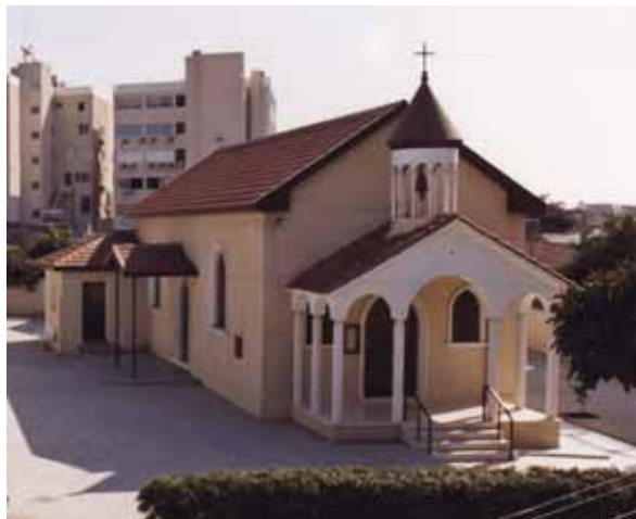
• Η εκκλησία του Αγίου Γεωργίου στη Λεμεσό (1995).