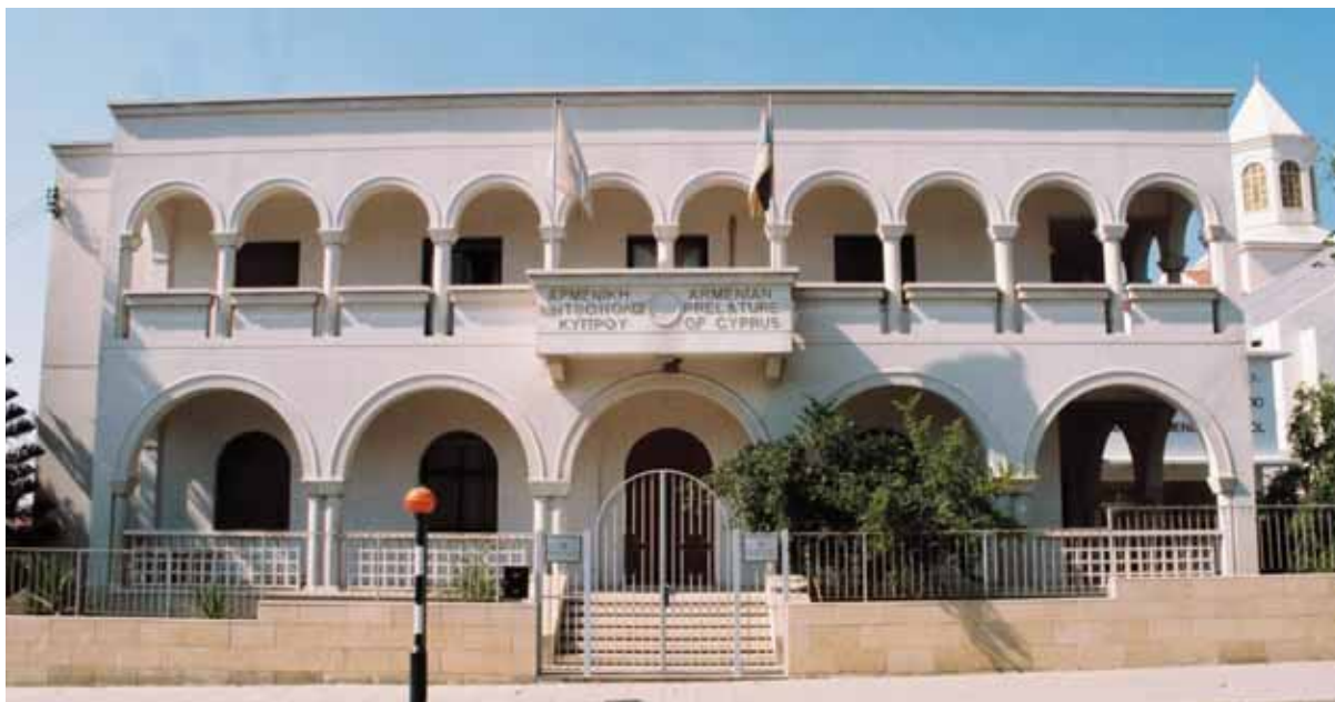
● Η Αρμενική Μητρόπολη (2003).

Το Καταστατικό της Μητρόπολης αποτελείται από 102 άρθρα και, στην παρούσα μορφή του, ισχύει από το 2010. Τη διοίκηση ασκεί η Αρμενική Εθναρχία (Αζκάιν Ισχανουτιούν) μέσω του Θρονικού Συμβουλίου (Τεμαγκάν Ζιογόβ) και του Εκτελεστικού Συμβουλίου (Βαρτσιαγκάν Ζιογόβ). Υπάρχουν, επίσης, τοπικές ενοριακές επιτροπές (Λευκωσία, Λάρνακα, Λεμεσός), η επιτροπή χριστιανικής κατήχησης και η επιτροπή κυριών. Η Μητρόπολη λαμβάνει ετήσια χορηγία από την Κυβέρνηση.