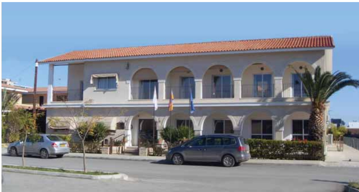
● Το Μέγαθο Ευγηρίας Καλαιτζιάν (2012).